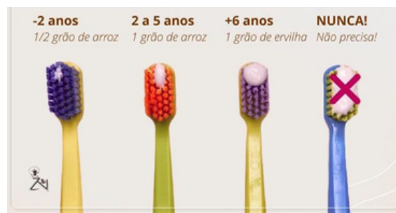
QUANTIDADE DE CREME DENTAL INDICADO para crianças